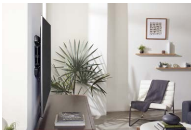
Das schlanke Profil hält den Fernseher dicht an der Wand und sorgt für einen elganten Look .