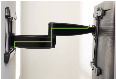
Schlankes In-Arm-Kabelmanagement für ein sauberes Design