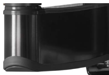
Gebürstete Schwarze Metalloberfläche