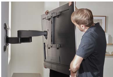
Präzisionsgefertigt für einfache Bewegung und Stabilität